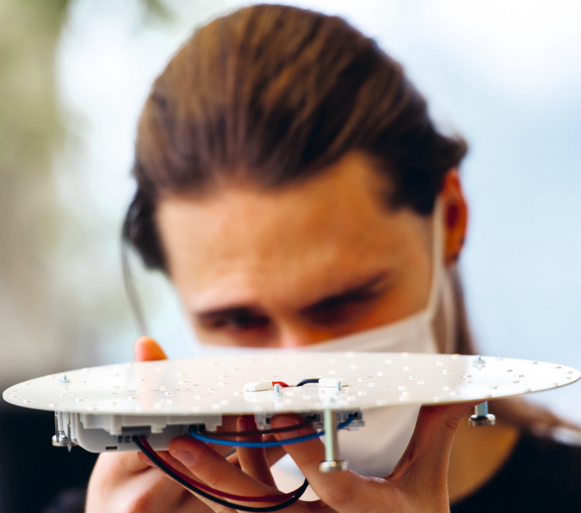
Foto: Prüfung eines LED-Prints