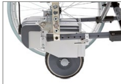
viamobil einfach an die zuvor am Rollstuhl montierte Halterung einhängen.