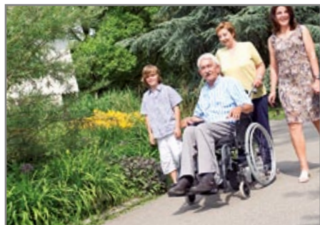
Komfortable Sicherheit auch bei Gefälle.