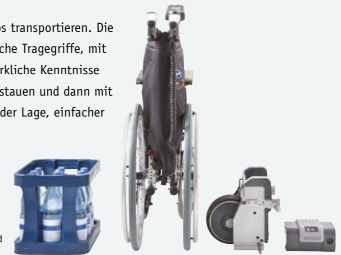
viamobil - klein, leicht, handlich und mühelos zu transportieren

viamobil lässt sich einfach und komfortabel auch in kleineren Autos transportieren. Die einzelnen Module sind leicht und robust und verfügen über praktische Tragegriffe, mit denen man sie schnell verladen kann. Ohne Werkzeug oder handwerkliche Kenntnisse können Sie viamobil abnehmen, mit dem Rollstuhl platzsparend verstauen und dann mit wenigen Handgriffen wieder betriebsbereit machen. So sind Sie in der Lage, einfacher und schneller mobil zu sein.