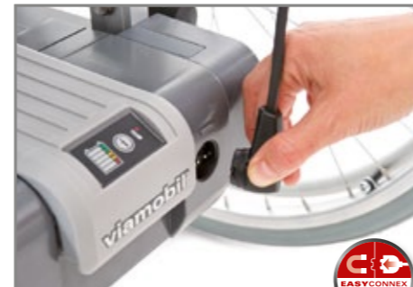
Bediengerät am Akku-Pack einstecken und los geht's!