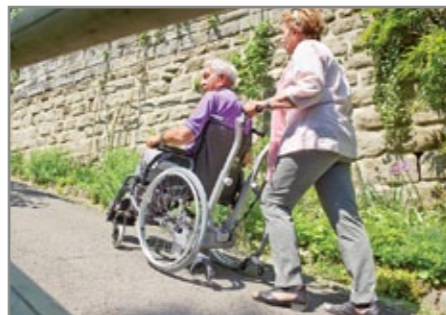
Steigungen ohne jede Anstrengung meistern.