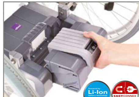
Mit nur einem Griff den Akku-Pack einlegen. Einfach und sicher.