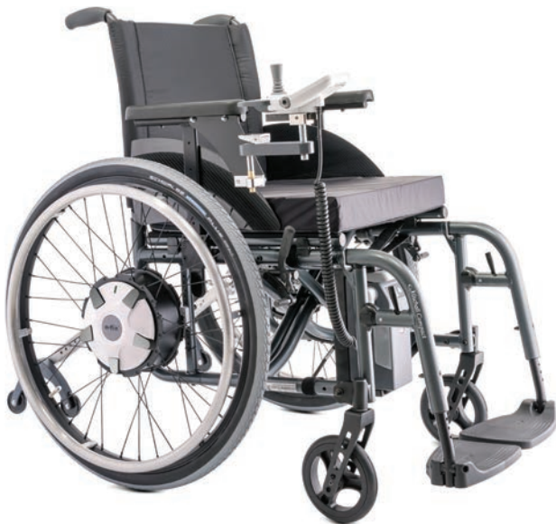
e-fix E36: kraftvolle Antriebsräder mit mehr Leistung (optional)

Durch das Magnet-Stecker-System EasyConnex findet der Stecker des Bediengeräts und des Ladegeräts sicher in seine Position. Auch die Auto-Kontaktierung des Akkus in der innovativen Akku-Aufnahme ist äußerst hilfreich im Alltag.