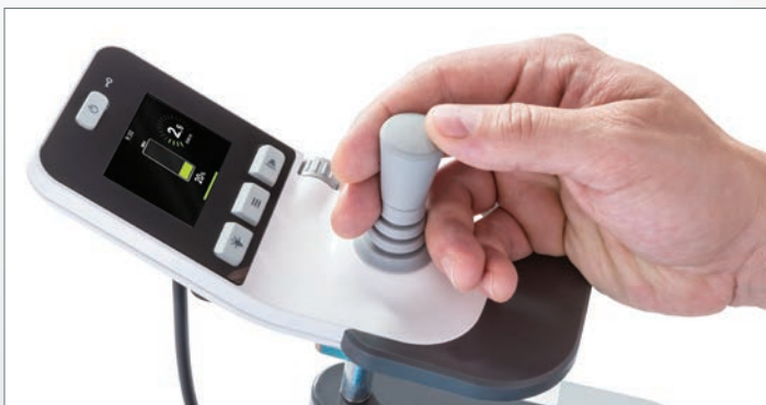
Aussagekräftiges Farbdisplay und benutzerfreundliche Bedienelemente