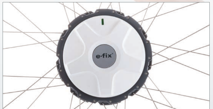
Kompakt, leise, kraftvoll: der e-fix Antrieb