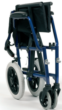
Rücken abklappbar für den Transport