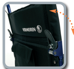
faltbare Rückenlehne mit integrierter Tasche

Ein perfekter Begleiter für den Urlaub, im Krankenhaus, bzw. für jeglichen Transport des Patienten. Extrem leicht, einfach zu falten, klein zum Verstauen.