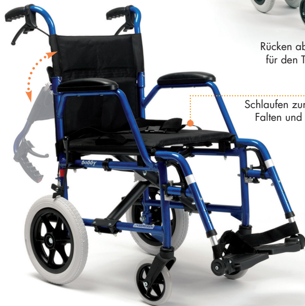
Schlaufen zum schnellen Falten und Tragen des Rollstuhls