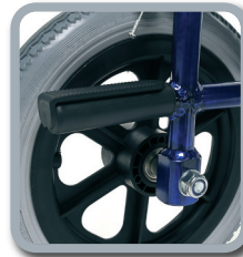
Ankipphilfe zum Neigen des Rollstuhls nach hinten