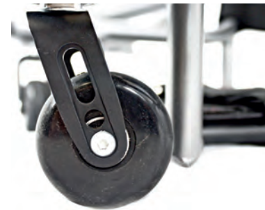
Integrierte Aluminium-Gabel. Leicht und widerstandsfähig