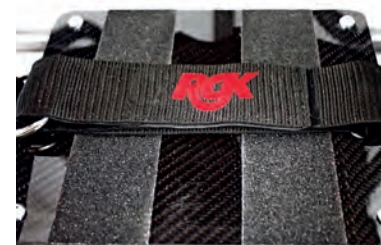
Integrierte Fussstütze mit Klettbindern