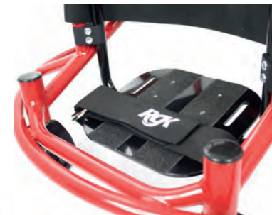
Höhen- und winkeleinstellbare Fussauflagen.