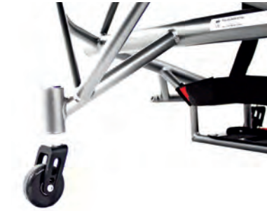
Integriertes höhenanpassbares Antikippgrad (einzeln oder als Paar)