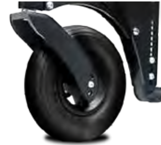
Lenkrolle mit 200 x 50 Luftbereifung