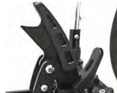
Schnellverschluss zum An- und Abdocken