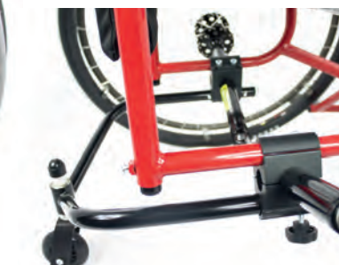
Anpassbarer Schwerpunkt und Schnellverschluss Antikippgrad.