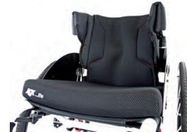
Integrierte laterale Stützen. Zusätzliche Stabilität - wo angezeigt.