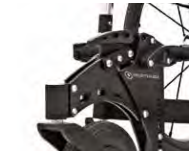
Stabile 3-Punkt Rahmenverbindung