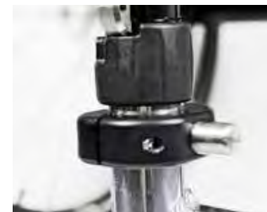
Kompatibel und nachrüstbar für die Rollstuhl Modelle Tiga, Tiga FX und Hi-Lite