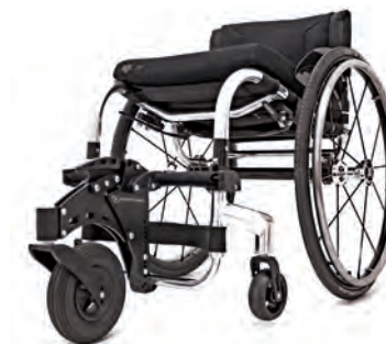
GROSSES VORDERRAD Ermöglicht ein sorgenfreies Fahren über "Stock und Stein". Für TIGA, TIGA FX & Hi Lite.