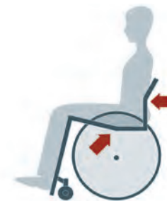
Ergonomischer Sitz und Rücken: optimiert Sitzposition & Stabilität, sowie verbessert Kraftübertragung auf den Rollstuhl.