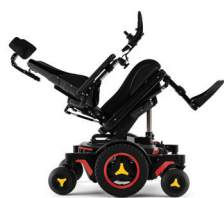
Neigungswinkel verstellbar (nach hinten)