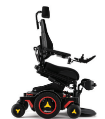
Neigungswinkel verstellbar (nach vorne)