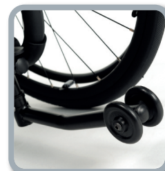
Optional flexibler Kippschutz

Kontaktieren Sie Ihren Fachhändler für die gesamte Farbpalette.