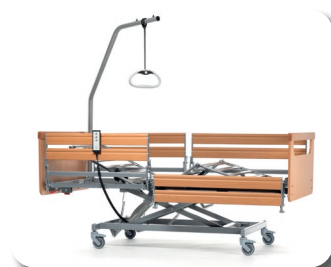
Optional mit geteilten Seitengitter Buche