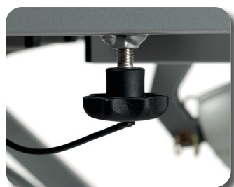
Einfache Montage und Demontage