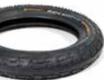
Continental TourRide Reifen m. Pannenschutz

Größe: 12 x 2.00" (310 x 50 mm) 14 x 2.00" (360 x 50 mm)