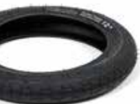
Trionic Primera Reifen m. Pannenschutz

Größe: 12 x 2.2" (310 x 57 mm) 14 x 2.2" (360 x 57 mm)