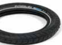
Schwalbe Big Apple Reifen m. Pannenschutz

Größe: 12 x 2.00" (310 x 50 mm) 14 x 2.00" (360 x 50 mm)