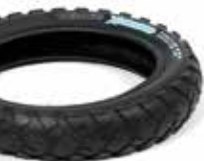
Trionic X-Country Reifen m. Pannenschutz

Größe: 12 x 2.2" (310 x 57 mm) 14 x 2.2" (360 x 57 mm)