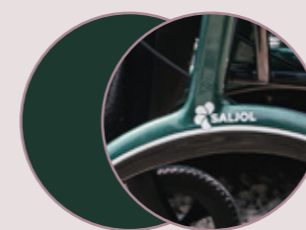
British Racing Green