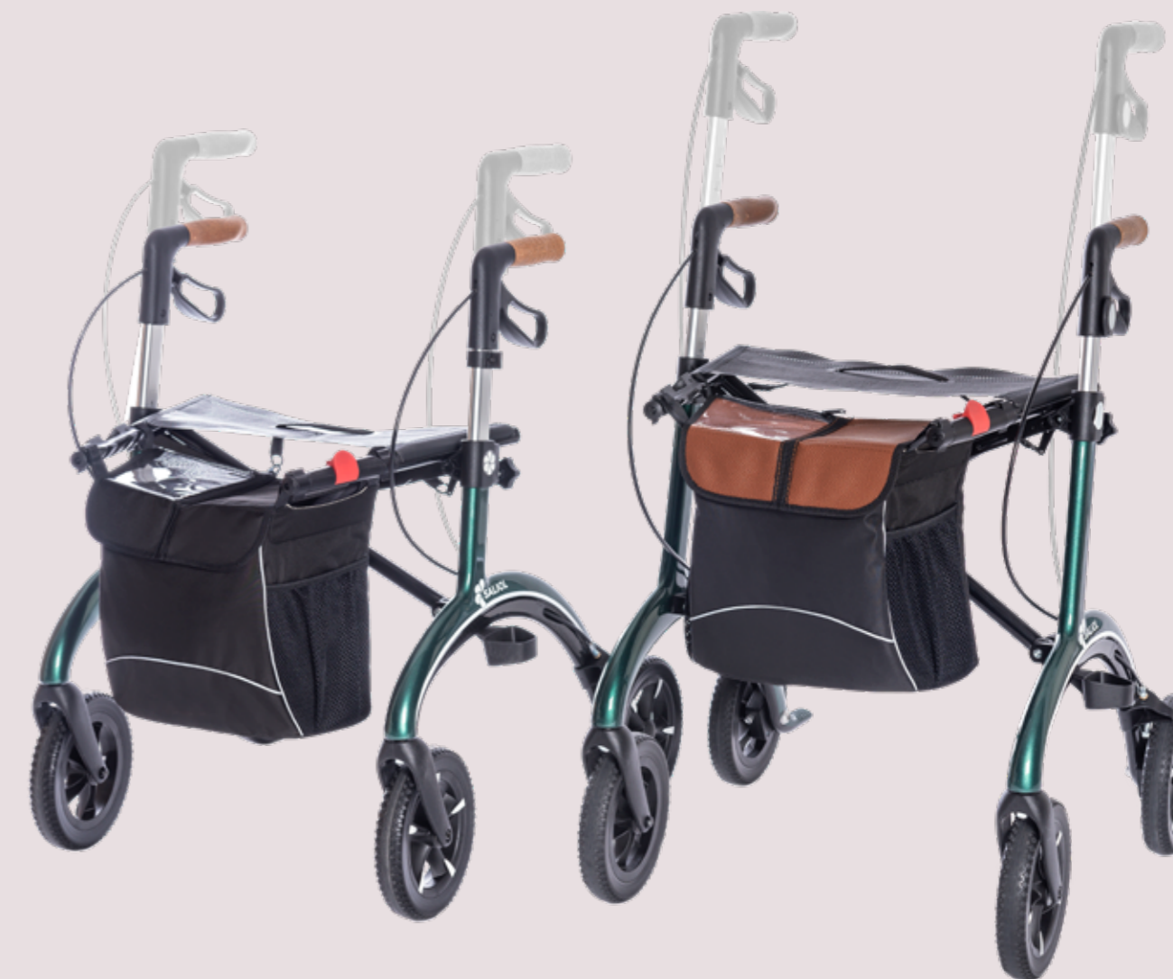
Klein <1,60 m Körpergröße