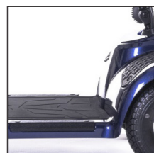
Niedriger Einstieg Accès plus bas