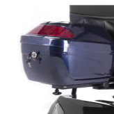
Heckbox Boîte arrière