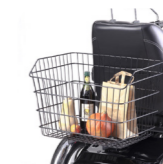
Heckkorb Panier large