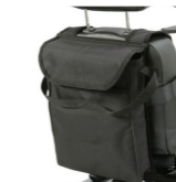
Sitztasche Sac de rangement