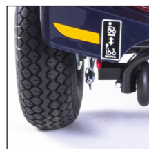
750W Motor 750W Moteur

Jetzt noch stärker! Maintenant encore plus fort!