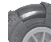
Nagelschutz Sauvegarde clou