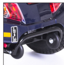
Rammschutz Barre de protection