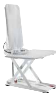
Aquatec Orca XL Mit absenkbarer Rückenlehne. Badewannenlifter mit besonders hoher Belastbarkeit: 170 kg!