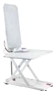
Aquatec Orca Mit absenkbarer Rückenlehne.