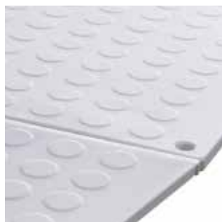
Auch ohne Bezug einsetzbar.