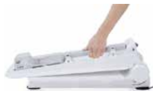
Einfacher Transport, schneller Aufbau und leichte Einweisung.